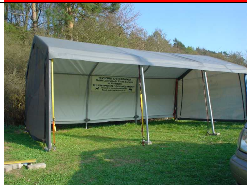
Wieder im Programm Modell OPEN AIR EC ab 499,-€ 3,7m x 6m x 2,6m mit 12 Beinen