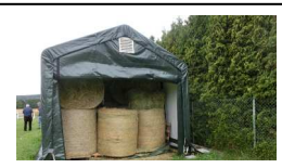
SquareTube 130Km/h Wind Schneelast 220kg/m 2